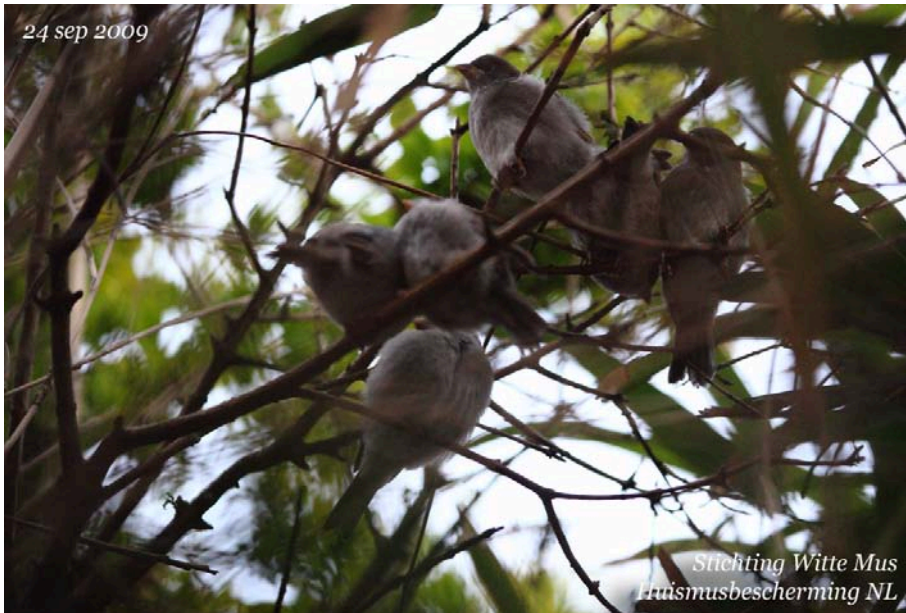
Nest van 7 jonge Huismussen zit tegen elkaar aan om samen te overnachten zoals in het nest gebruikelijk was. Hieraan kun je zien dat deze jongen zeer recent (vandaag) zijn uitgevlogen. Datum op foto is incorrect. Moet zijn 29 mei 2012.

In de nesten wordt ook geslapen, maar alleen door de broedende vrouwtjes, en de jongen die nog niet uitgevlogen zijn. Niet door gemengde groepen huismussen. Na het broedseizoen kunnen wel de laatste jongen van dat nest er gaan overnachten, totdat het broedseizoen weer in voorbereiding is.