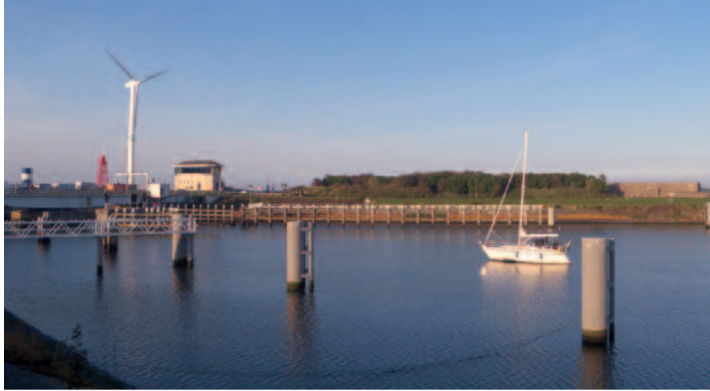
Kleine windturbine langs Afsluitdijk, ter hoogte van Den Oever. Hier en in de omgeving zullen in de toekomst meerdere hoog rendement turbines worden geplaatst (foto: Anne-Jifke Haarsma).

1. Voorkómen van slachtoffers is het beste. Vleermuizen volgen bij de migratie vaak allerlei lijnvormige elementen, zoals een bosrand, dijktaalud, langs kust van meer of zee (vleermuizen migreren zowel over land als over water, soms worden dieren ook tot ver op zee waargenomen (Boshamer & Bekker, 2008)). Diverse onderzoekers (o.a. Rodrigues et al., 2008) adviseren om die