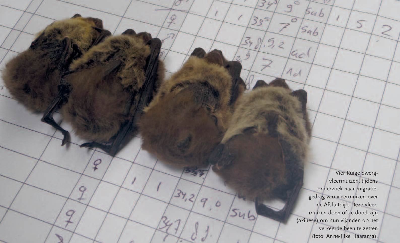
Vier Ruige dwergvleermuizen, tijdens onderzoek naar migratiegedrag van vleermuizen over de Afsluitdijk. Deze vleermuizen doen of ze dood zijn (akinese) om hun vijanden op het verkeerde been te zetten (foto: Anne-Jifke Haarsma).