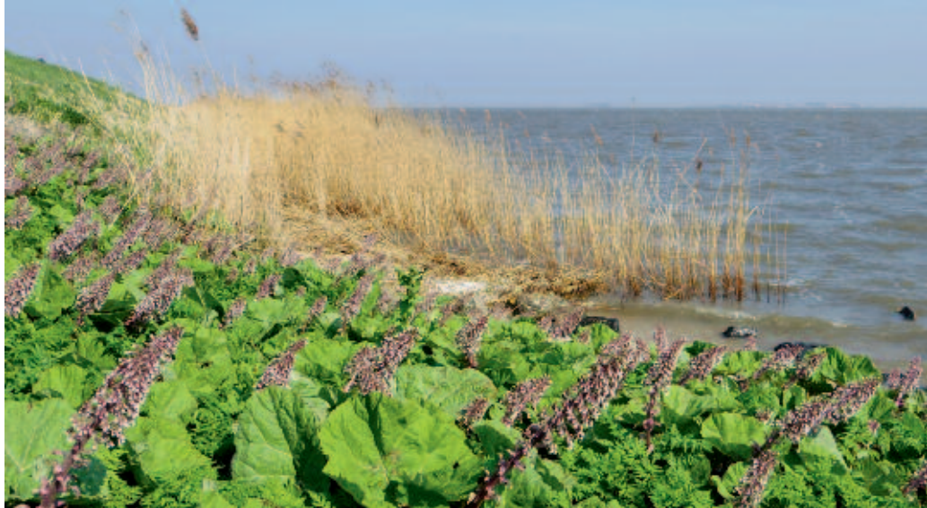
Zo zien vleermuizen de kust van het IJsselmeer het liefst, met vegetatie en een verlandingszone en zonder windturbines.