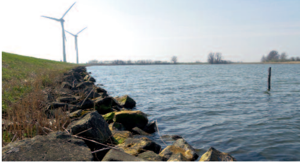
Voor vleermuizen een risicogebied: twee windturbines langs de oever van het IJsselmeer.

Wordt deze kennis nu toegepast, zodat er voor vleermuizen optimale ontwerpen voor windmolenparken tot stand komen? Als casus wordt hier het toekomstige Windpark Wieringermeer nader geanalyseerd. Voor dit project is een milieueffectrapportage gepubliceerd (van de Bilt et al., 2014). In dit project worden bestaande windmolens vervangen door meer en grotere turbines die in een andere configuratie staan. Bij de voorgenomen plaatsing van de meerderheid van de geplande molens is redelijk met belangen van vogels en vleermuizen rekening gehouden. Echter, vijf turbines (van de in totaal >100) zijn geprojecteerd in het Robbenoordbos, vanuit het risico voor vleermuisslachtoffers gezien een probleemlocatie (fig. 2). Uit de analyse is gebleken dat deze molens een onevenredig deel van de verwachte slachtoffers onder vleermuizen zullen veroorzaken. Waarnemingen hebben uitgewezen dat 1) verschillende vleermuissoorten in de Wieringermeer in dit gebied zijn geconcentreerd, nl. Meervleermuis, Watervleermuis en Ruige dwergvleermuis; 2) het bos aansluit op de Afsluitdijk, die als trekroute voor met name de Ruige dwergvleermuis fungeert, waardoor periodiek zeer grote aantallen (tienduizenden) dieren dit gebied aandoen (Zwerver, 2012). Een geschat aantal van 200 dieren woont jaarrond in dit gebied (Haarsma & Boshamer, 2014). Vanwege de gevoeligheid van het gebied is hier besloten om mitigerende maatregelen (maatregelen die het negatieve effect moeten verzachten) voor te schrijven; namelijk