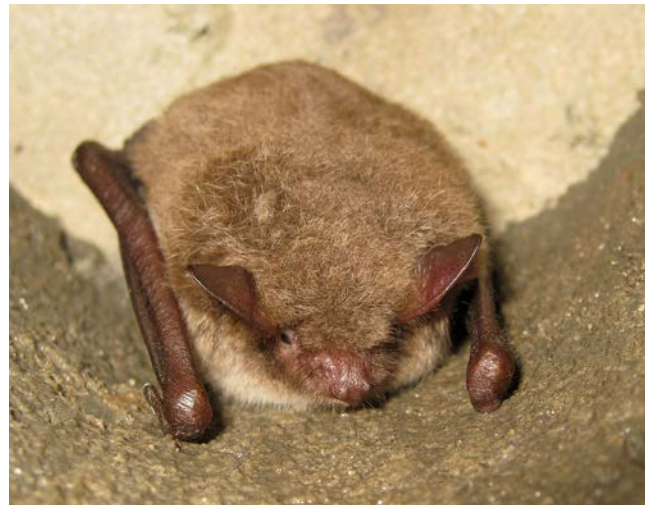
Watervleermuis ( Myotis daubentonii )

Afdeling DSU/Rabiës Houtribweg 39 8221 RA Lelystad